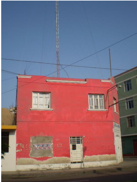
Fachada del lugar donde nació radio Tropicana en plena avenida José Rufino Echenique.