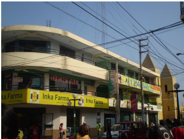
Ubicación actual de Radio Cosmos en el jirón La Merced, inicialmente ubicó en el pasaje "zeta".